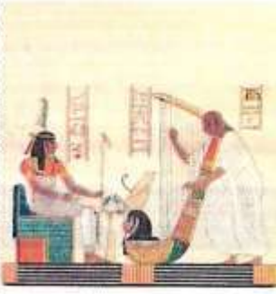
العزف على الآلات الموسيقية