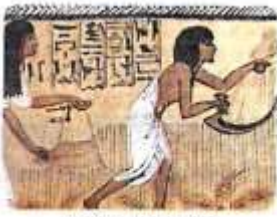
عيد الحصاد قديماً