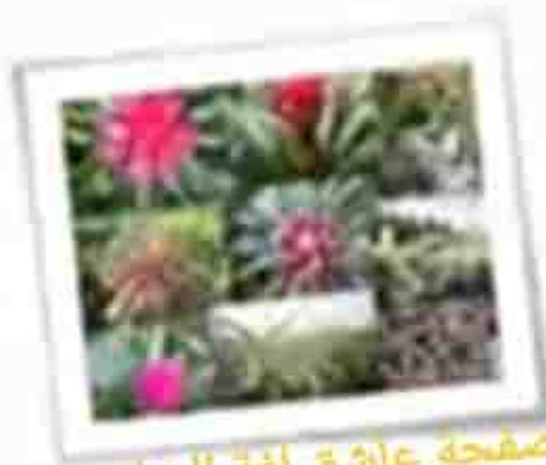
النباتات التي تنمو على نباتات أخرى