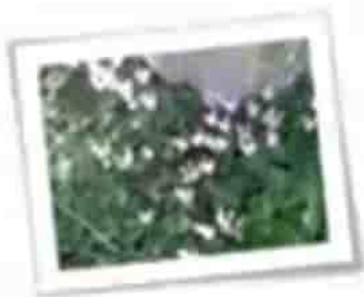
النباتات التي تنمو على الصخور

التربة ليست حاجة أساسية للنبات حيث أن بعض النباتات تستطيع أن تنمو بدون تربة مثل :