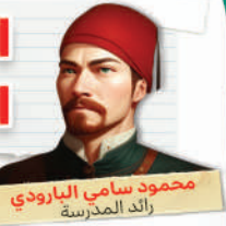
محمود سامي البارودي رائد المدرسة

1 رائد وشعراء المدرسة محمود سامي البارودي هو رائد المدرسة الكلاسيكية (الإحياء والبعث) فقد أحيى الشعر بعدما أصابه من ركود وضعف على يد الشعراء السابقين.