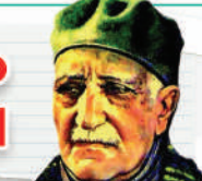
محمود عباس العقاد