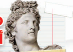
سُميت المدرسة بهذا الاسم نسبة إلى إله النور والفن والجمال عند اليونانيين.