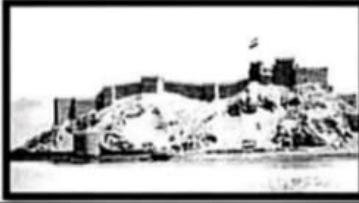
قلعة صلاح الدين بطابا / تراث .....

١- أمامك مجموعة من الصور اكتب اسفل كل صورة هل هي (تراث طبيعي) أم (تراث ثقافي)