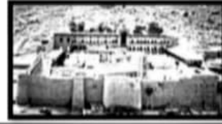
دير سانت كاترين بمحافظة .....