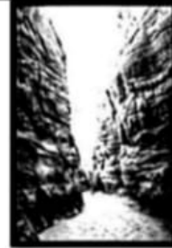
الوادي الملون بسيناء / تراث .....