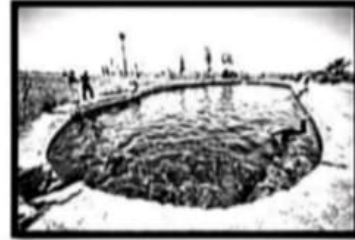
عيون كبريتية / سياحة .....