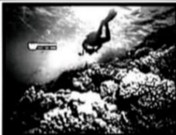
شعاب مرجانية / سياحة .....