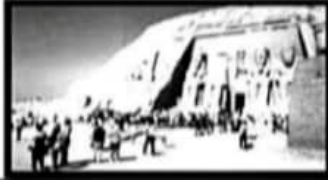
معبد ابو سمبل بمحافظة .....

١- أمامك مجموعة من الصور لاماكن تراثية في مصر حدد اسماء المحافظات التي توجد بها هذه الاماكن :