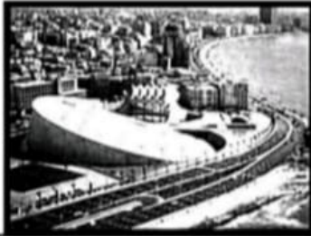
مكتبة الاسكندرية / سياحة .....

١- أمامك مجموعة من الصور حدد نوع السياحة الموجودة بها :