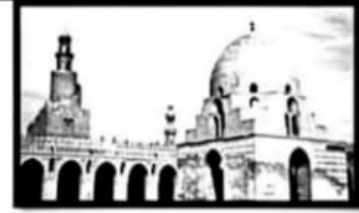
مسجد احمد بن طولون / تراث .....