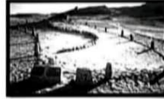
وادي الحيتان بمحافظة .....