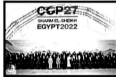
مؤتمر المناخ / سياحة .....

٢- " تسهم السياحة في دعم الاقتصاد المصري وتوفر فرص عمل للشباب"