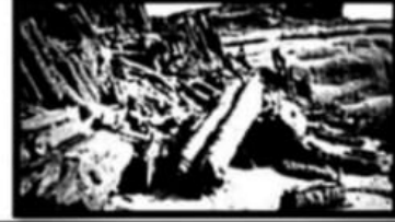
الغابة المتحجرة / تراث .....