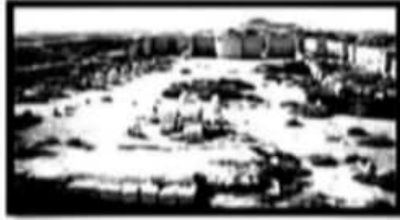
منطقة ابو مينا بمحافظة .....