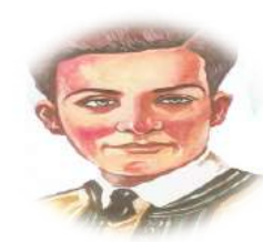
أبو القاسم الشابي

أحمد زكي أبو شادي، إبراهيم ناجي، علي محمود طه، محمد عبد المعطي الهمشيري، أحمد رامي.