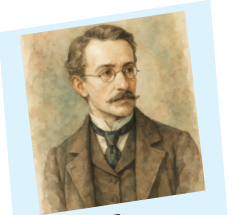
Professor Pierre Aronnax

الكابتن نيمو هو رجل غامض وذكي يقود الغواصة نوتيلوس. شجاع وواسع المعرفة ويحب البحر، لكنه يخفي ماضيًا حزينًا وسريًا.