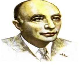
للشاعر: إبراهيم ناجي