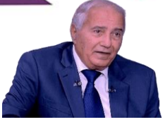
للشاعر: فاروق جويده