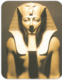
الملك تحتمس الثالث

٣ « يُعد الملكان اللذان أمامك واللذان خاضا حروباً دفاعية قوية ضد الأعداء من أهم ملوك الدولة الحديثة ». وضح صحة العبارة السابقة.