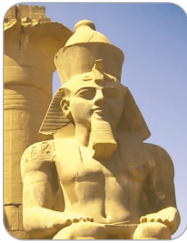
الملك رمسيس الثاني