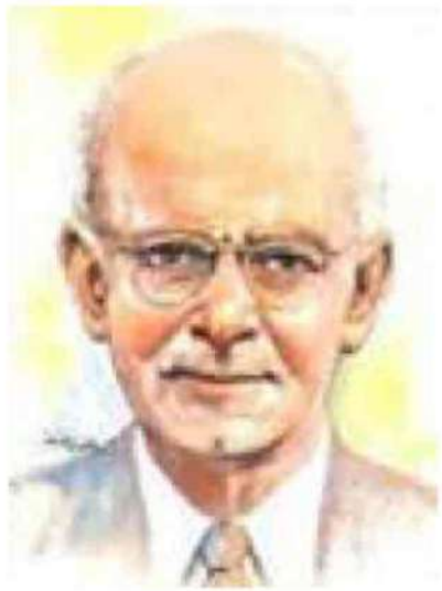
إيليا ابو ماضي